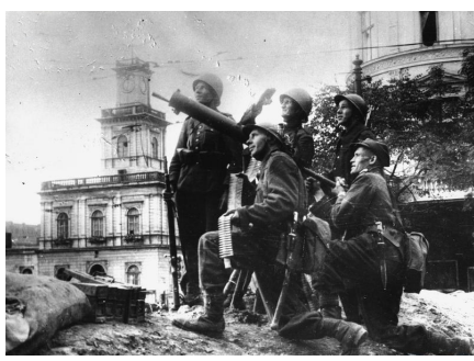
Unité anti-aérienne polonaise durant le siège, septembre 1939.

À cause d'une trêve signée entre les deux protagonistes pour permettre l'évacuation du personnel diplomatique des pays neutres, la Luftwaffe n'intervient qu'à partir du 22 septembre avec le bombardement des installations de DCA et des installations militaires par la Luftflotte 1. La Luftflotte 4 bombarde les points les plus fortifiés de la ville. Les bombardements se poursuivent pendant deux jours avec, le 24 septembre, la venue de Hitler qui observe les bombardements depuis un clocher située à proximité de la ville. Il ordonne alors de laisser tomber l'assaut sur Praga pour attaquer Varsovie directement. Mais les Allemands sont très gênés dans leurs préparatifs par les sorties polonaises qui sont cependant coûteuses pour les assiégés. Von